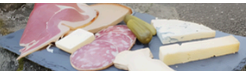
Planche de fromages AOP d'Auvergne et charcuteries locales. Boisson comprise.